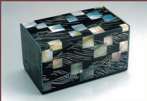
螺細工「瀟瀟」 山本哲 作

日帰り利用時間：11時~14時 (予約制。1部は11時~12時、2部は13時~14時) 利用料：大人2000円(小学生を除く12歳以上)昼食付き