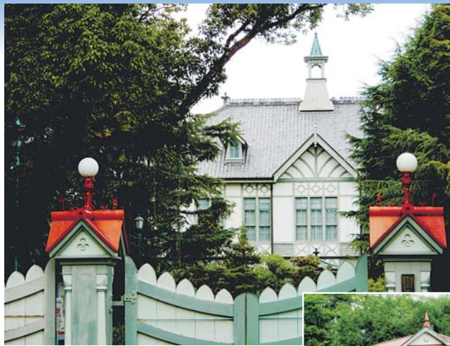
明治期の貴重な近代建築「旧奈良警察署鍋屋連絡所」は観光案内所として活用されている

きたまち青空テラス、開催。東向本商店街の通りに、お洒落なバルコニーやカフェエディブルセットが一目見え。3密を避け、日差しよけのバルコニーの下、換気の良い、土曜で食事が楽しめる。11月末までの、土曜を中心に開催される予定