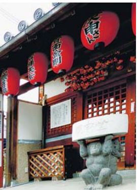
庚申信仰の拠点・庚申堂

近鉄奈良駅の南側、世界遺産・元興寺の旧境内を中心とする地域一帯を総称する「ならまち」は、近年、情報誌などでも頻繁に取り上げられ、人々にやすらぎと潤いを与え、時には懐かしささえ感じさせてくれるスポットとして人気だ。平城京の外京にあたり、当時の道筋をもとに発展した長い歴史を持つ。平城京への遷都以来まちづくりが始まり、南都と呼ばれた社寺のまちから商業のまちへ。今も江戸時代末期から明