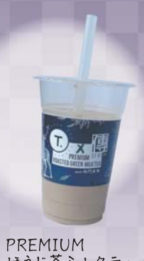
PREMIUM ほうじ茶ミルクティー

傳 砂糖傳 増尾商店 DEN お問い合わせ ☎0742-26-2307 〒630-8332 奈良市元興寺町10 [営業時間 9:00~18:00]