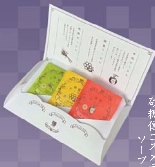
砂糖傳 コスメティックソーファキフト

金平糖(こんべいとう)の語源は、ポルトガル語「confeito(コンフェイト)」。こだわりの素材とどこか懐かしい味は、奈良土産にもお茶請けにもおすすめです。